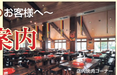
店内焼肉コーナー